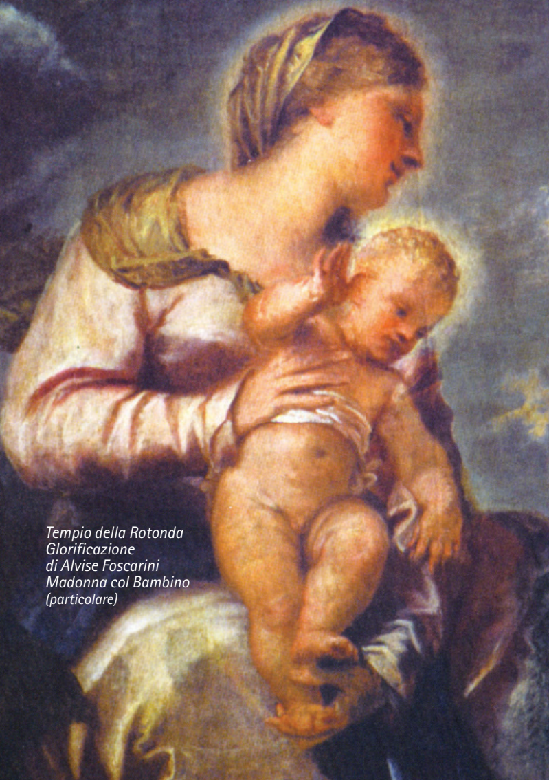
Tempio della Rotonda Glorificazione di Alvise Foscari Madonna col Bambino (particolare)