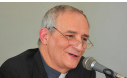
M. M. Zuppi Cardinale di Bologna