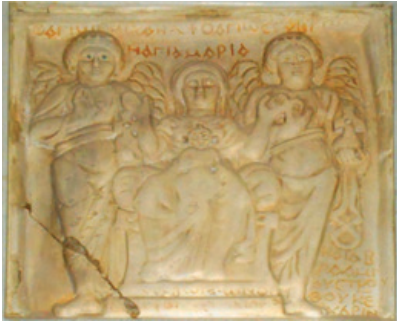
Bassorilievo Copto Cattedrale di Adria